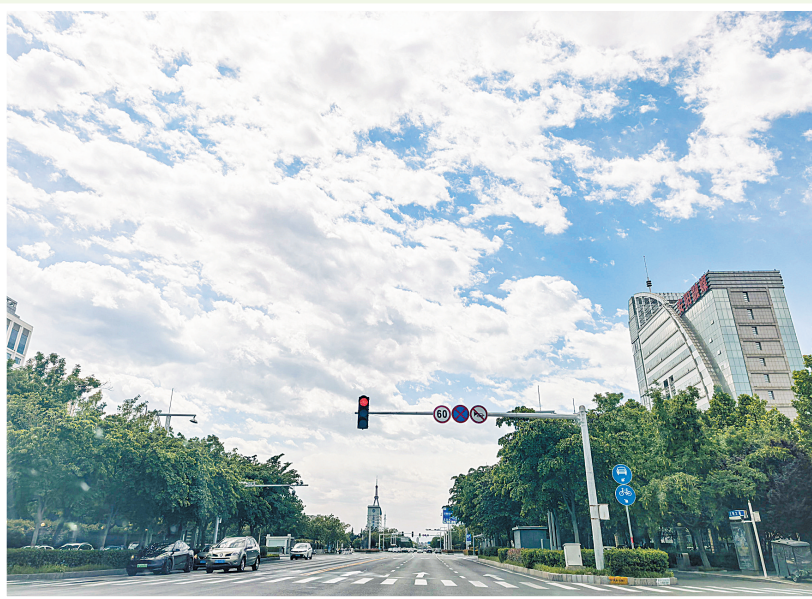
蓝天白云映衬下的文明大道