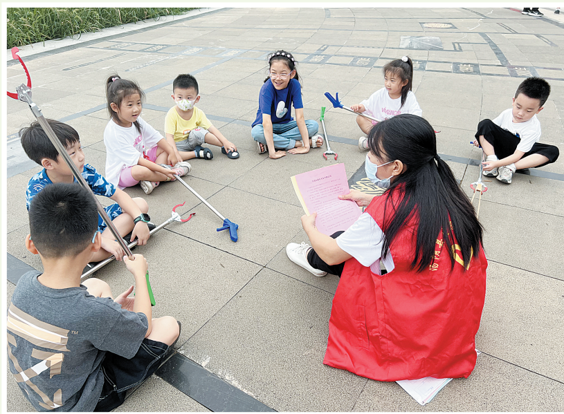
“保护母亲河”文明实践志愿活动中,大志愿者向小志愿者传递环保理念(本报记者 黄亚楠 摄)