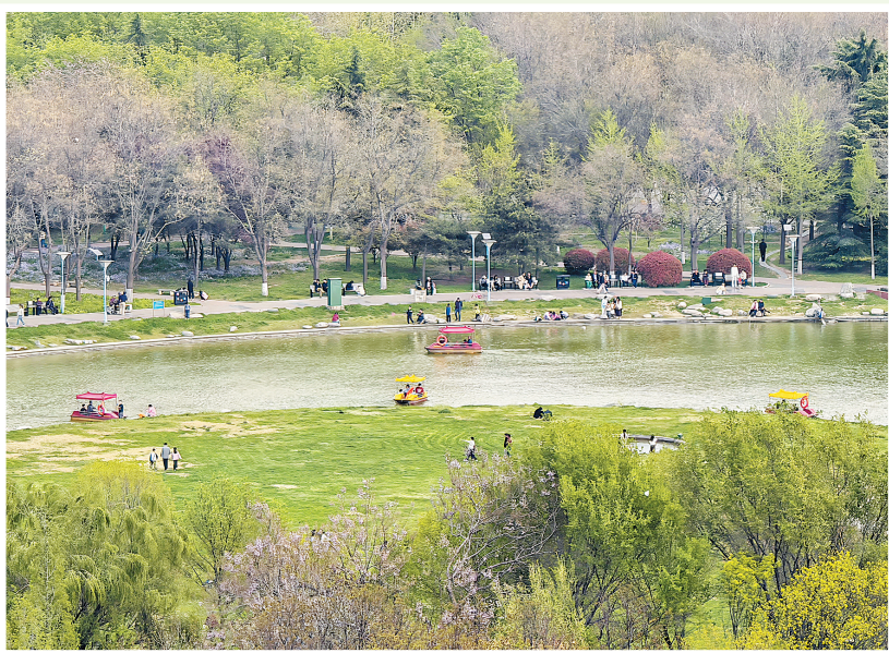
易园内绿植错落有致