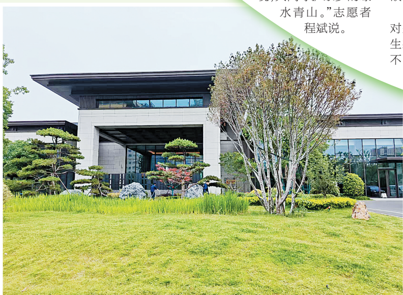
我市一幢绿色建筑