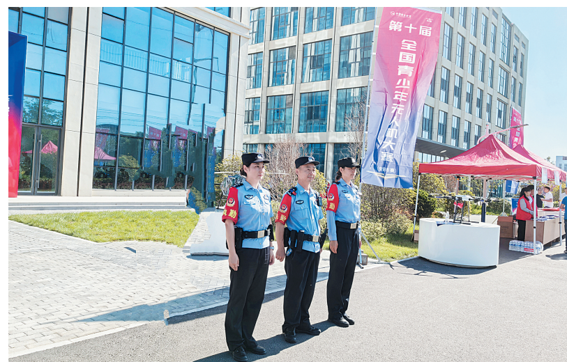
5月30日上午,市公安局北关分局彰北派出所民辅警在第十届全国青少年无人机大赛安阳市选拔赛现场执勤。(本报记者 王璐 摄)

这起纠纷的圆满化解,是该院践行“司法为民”理念的一个缩影。近年来,该院坚持把未成年人保护融入每一起案件、每一次调解、每一份判决之中。以全院之力,为未成年人撑起更加坚实、更加温暖的法治保护伞。