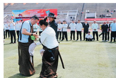
组图图为运动会现场