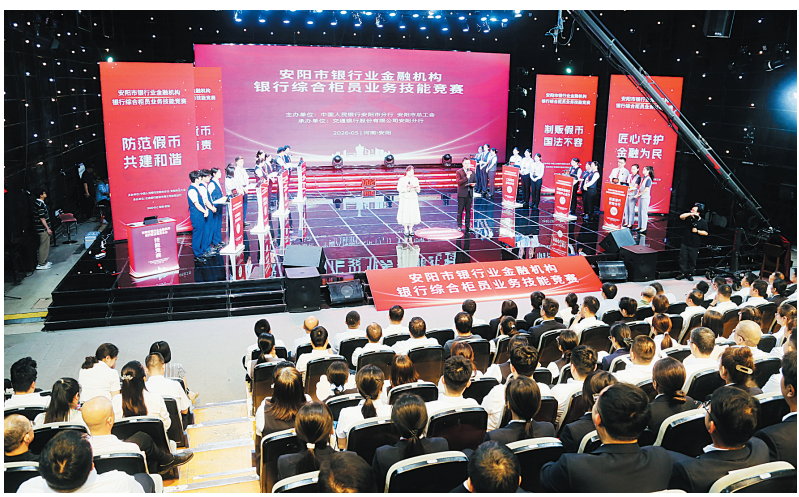
比赛现场

匠心筑梦,金融为民再出发。本次竞赛不仅是一场业务技能的比拼,更是一次现金服务理念、深度践行的深度践行。下一步,中国人民银行安阳市分行将继续引领辖区银行业金融机构坚守金融初心、勇担时代使命,为建设现代化区域中心城市、助力“十五五”高质量发展贡献坚实的金融力量。