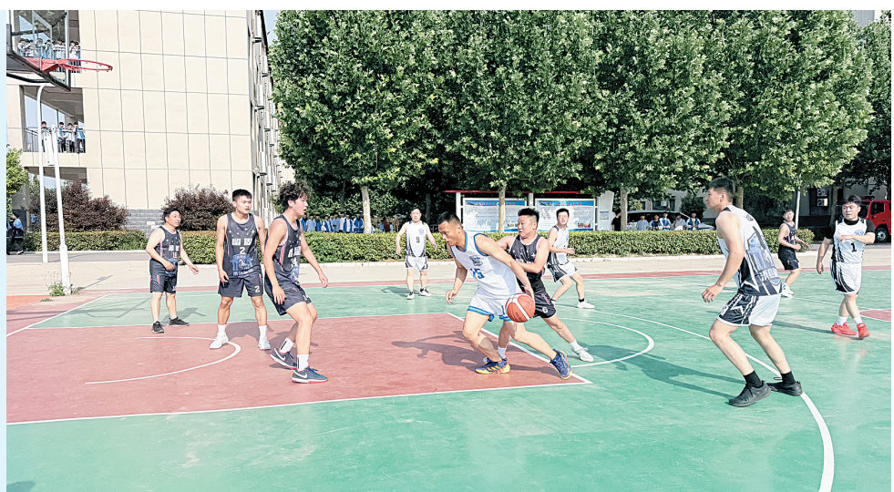
留固镇和美乡村·滑篮而上”2026年篮球比赛现场照片。