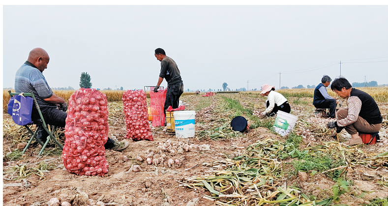
焦虎镇积极优化农业种植结构,引导农户规模化种植大蒜等特色作物,有效拓宽了群众的增收渠道。眼下,大蒜迎来丰收,田间地头呈现一派繁忙的采收景象。图为5月24日,陈小营村村民在田间采收大蒜。

瓦岗寨乡党委副书记徐顺子表示:“我们将持续深化‘托育+便民’服务模式,做优做强周末公益托管服务品牌。一方面,充实专业服务队伍力量,引入更多教育、文体、科普等领域的志愿者,不断丰富托育课程和活动内容;另一方面,进一步完善党群服务中心配套设施和服务功能,让群众在家门口就能享受到更优质、更贴心的民生服务,让党建引领的民生温度真正触达每个群众。”