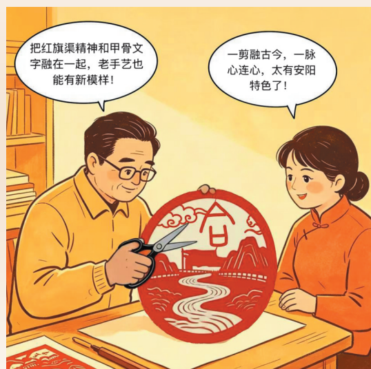
非遗剪纸工作室,手艺人运用红旗渠元素和甲骨文“合”字进行创作。