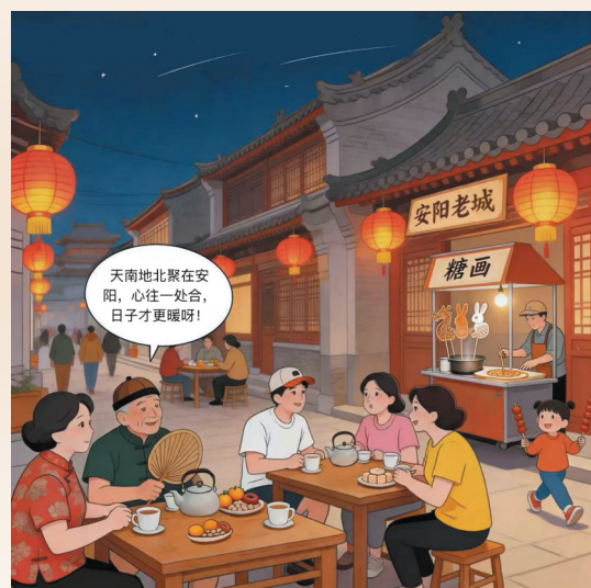
安阳老城街头,街坊邻里、各地游客围坐闲谈,共享烟火日常。

漫画 安阳师范学院美术学院动画专业 全雪晶 校审 安阳师范学院美术学院副教授 王华威