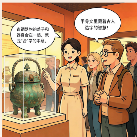
在殷墟博物馆展厅,外国友人驻足观看青铜器,讲解员在一旁解说。