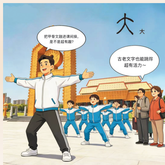
城市广场上,少年们正在做甲骨文广播体操,他们伸展身体,活力满满,文化与体育相融合!