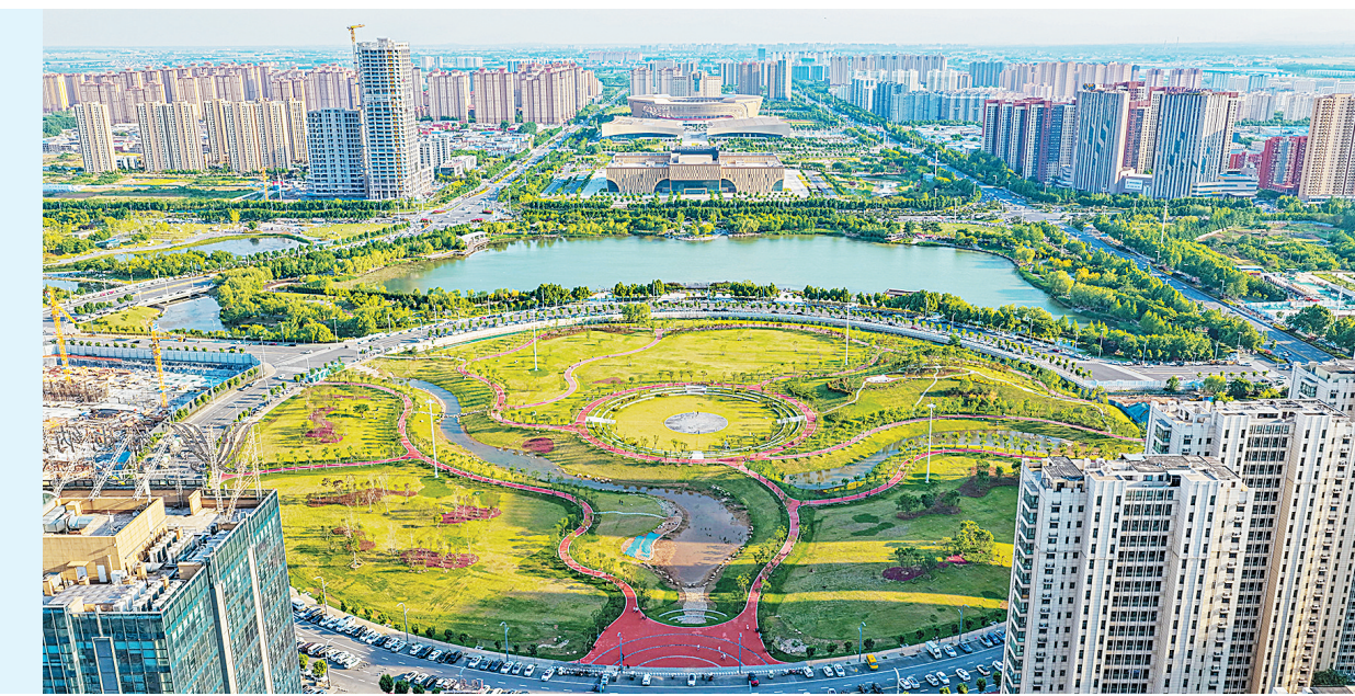
近日,清风徐来,安阳市CBD海绵公园环境优美、绿意盎然,依托海绵城市设计理念打造生态休闲空间。不少市民纷纷前去散步游玩、拍照打卡,享受城市绿意风光。