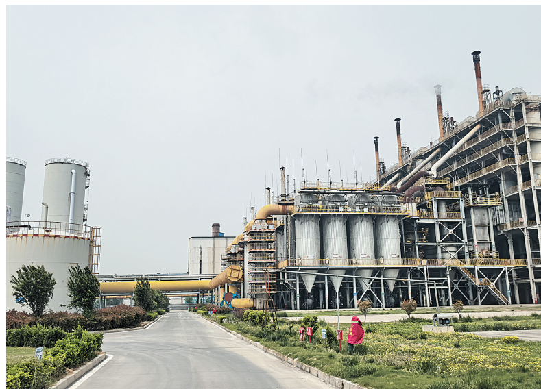
位于内黄县的安阳瑞美达清洁能源有限公司是河南省唯一的清洁工业燃气集中制气企业,被纳入“中央生态环境资金项目储备库”,具备A级企业清洁能源燃料使用标准。图为5月15日,该企业厂区一角。

量”转化为经济“留量”。“下一步,我们将持续深入学习贯彻习近平总书记关于服务业发展的重要指示和在河南考察时重要讲话精神,严格落实省委、省政府关于服务业发展工作部署,锚定服务业优质高效发展核心目标,推动全市服务业创新发展,加快服务业新业态培育、新技术应用、新领域拓展,促进‘安阳服务’品质和影响力持续提升。”市发展和改革委员会相关负责人说。