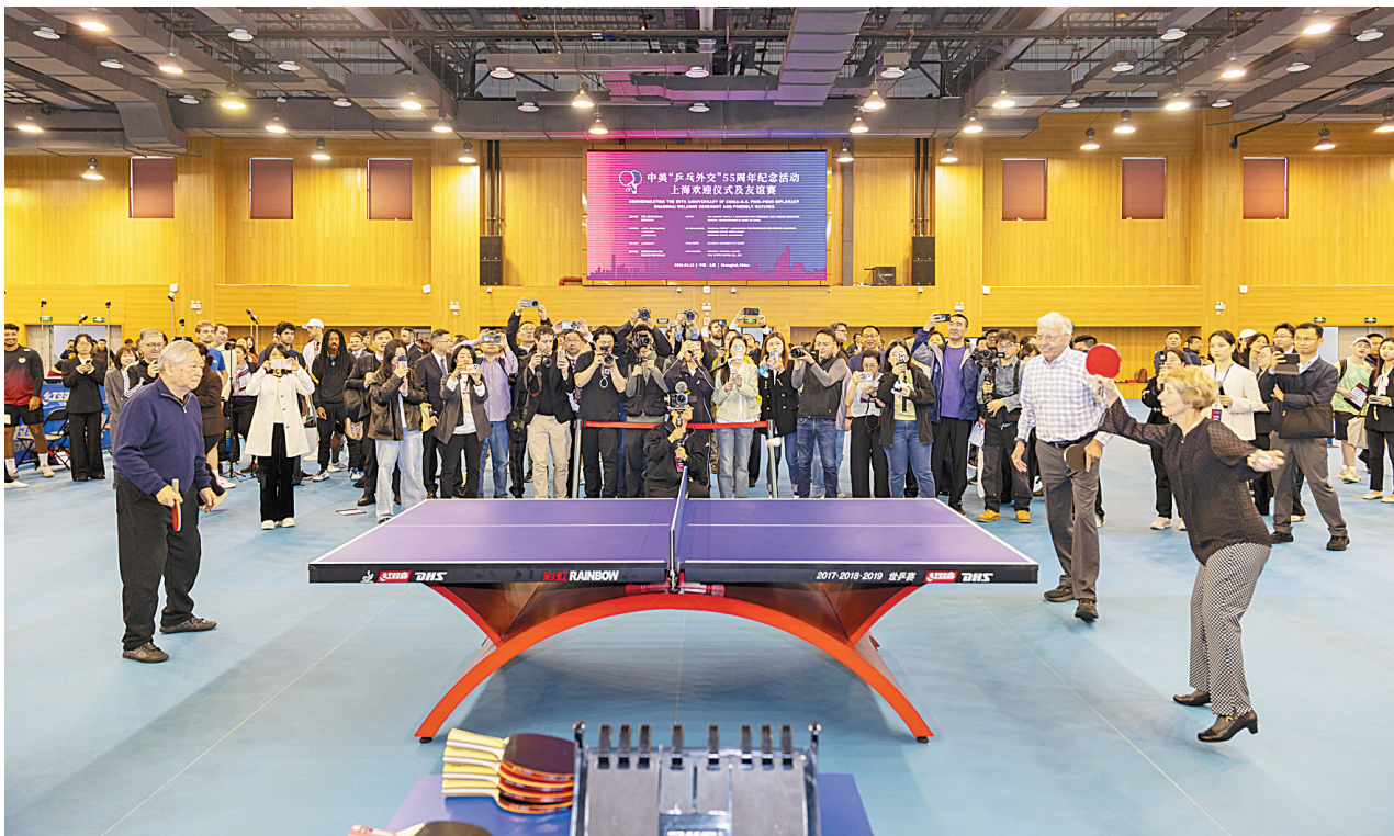
2026年4月13日,在上海举行的中美“乒乓外交”55周年纪念活动上,中美代表为友谊赛开球。

新加坡国立大学李光耀公共政策学院副教授顾清扬表示,“建设性战略稳定”明确了中美关系发展的新方向。中美有分歧,甚至有些分歧可能很大,但可以通过理性的方式加以管控。”这是此次中美元首会晤取得的一个巨大成功,对世