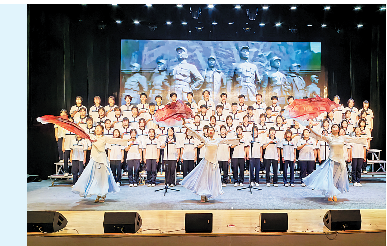
五月风暖,薪火相传;歌声激昂,青春逐光。为赓续红色血脉,传承五四精神,丰富校园文化生活,展现学子昂扬向上的精神风貌,5月13日,安阳市中等职业技术学校“红旗渠精神代代传”红五月合唱比赛举行。师生齐聚一堂,用嘹亮的歌声奏响青春的乐章,向伟大的祖国和时代致敬。