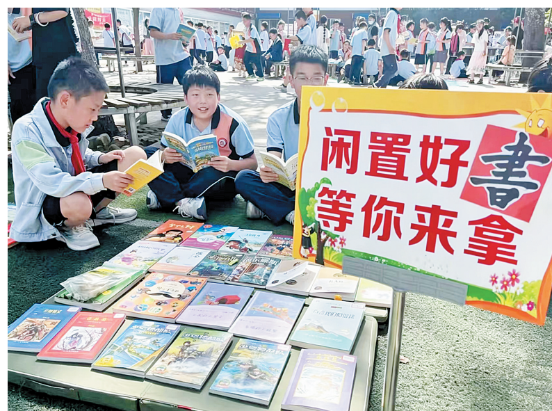
5月11日下午,市健康路小学开展了第四届校园淘书市活动。活动现场,各班摊位整齐排列,各类课外读物琳琅满目。同学们化身小小摊主,热情吆喝,精心推介书籍,往来同学驻足挑选、互换读物。因为学生在书摊前选购图书。

劳动教育开展情况与学生实践成果。整齐的劳作场地、充满童趣的学生手工作品、清晰完善的劳育规划,赢得了在场嘉宾的一致认可与高度评价。 此次劳动实践基地启动仪式的圆满举行,是市永安东街小学践行“五育并举”、落实立德树人根本任务的重要里程碑。该校党支部书记、校长冯文斌表示,将以基地为平台,让学生走出课堂、亲身参与劳动实践,在体验中磨砺意志、涵养品格。未来,该校将持续推进劳动教育常态化、特色化,坚持以劳树德、以劳增智、以劳强体、以劳育美,助力学生全面发展,让劳动教育之花在校园恒久绽放。