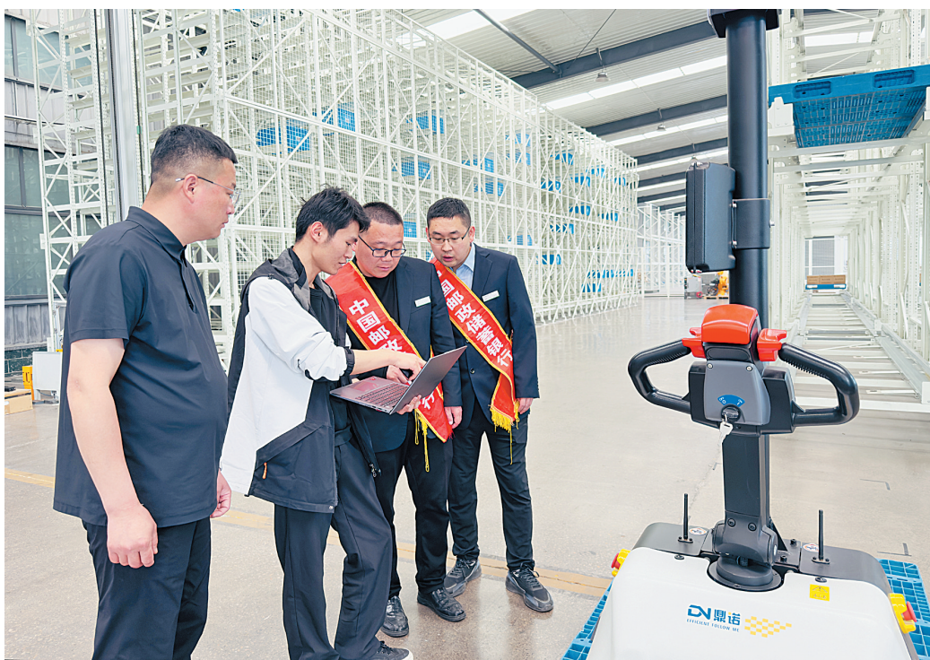
邮储银行安阳市分行工作人员深入企业了解情况

数据见证实效。截至今年3月底,邮储银行安阳市分行普惠小微贷款余额达81.54亿元,本年净增8.45亿元,普惠小微贷款较年初增速11.56%,同比增速23.14%,金融服务覆盖面与可得性显著提升。同时,该行持续减费让利,优化服务流程,今年年初以来发放的普惠小微贷款加权平均利率低至3.74%,较年初下降31个基点,有效降低了小微企业融资成本,助力经营主体纾困发展,赢得客户广泛认可。