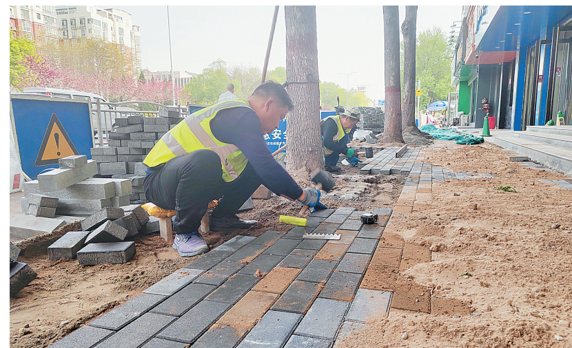
为加强道路精细化管理,营造良好出行环境,今年,我市继续对道路两侧人行道地砖进行更换维修,共7个路段,包括彰德路、解放大道、安漳大道等,着力完善基础设施,提升城市形象。图为4月6日,市政维护发展中心施工人员在彰德路两侧铺设人行道地砖。

温馨提醒:“民政通”(含小程序和APP)是申请、核销养老服务消费券的唯一渠道,其他任何方式均可能涉及养老诈骗。请老年朋友及其亲属不要相信任何人、任何机构要求的通过其他方式申请、核销养老服务消费券。