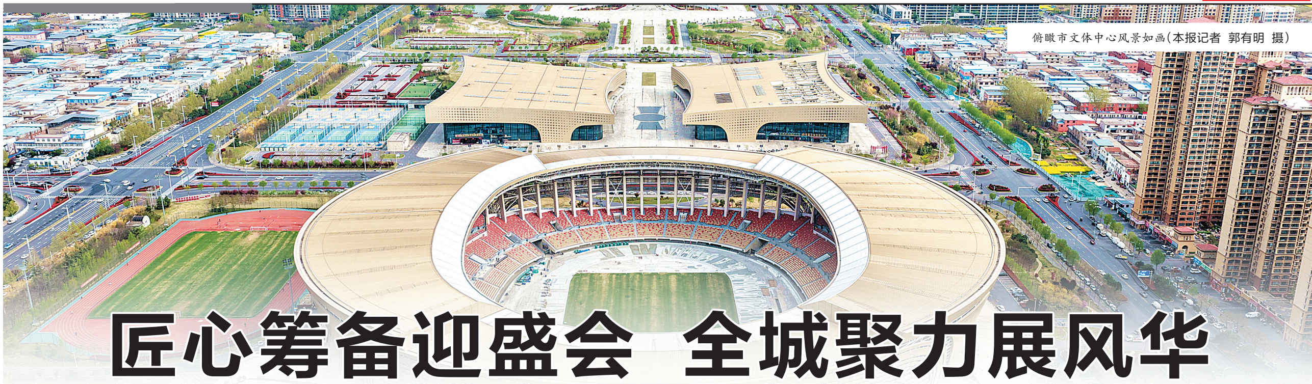
俯瞰市文体中心风景如画