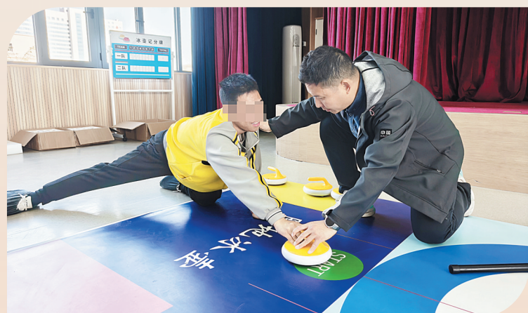
旱地冰壶项目教练指导队员