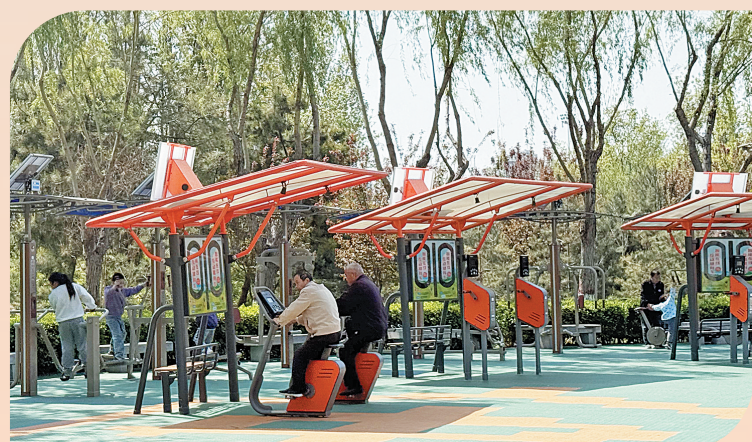
市民在智能健身器材上健身