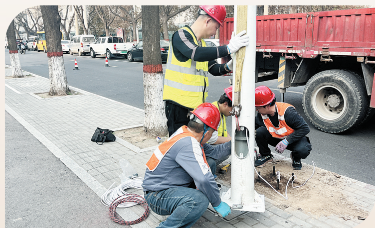
工人维修亮化设施

城市亮化与市政设施完好,是城市风貌的生动展现。市智慧城市建设中心近期对城区主干道、重点区域的照明设施、井盖、手孔盖等开展拉网式排查整改,加密巡查频次、精细运维管理;累计修复大片灭灯302处,修理灭灯1358盏,更换灯头1241个,修复井盖39处,妥善处理各类安全隐患47处,以精致管理点亮城市夜景、保障设施完好,为大赛营造安全舒心、亮丽有序的城市环境。