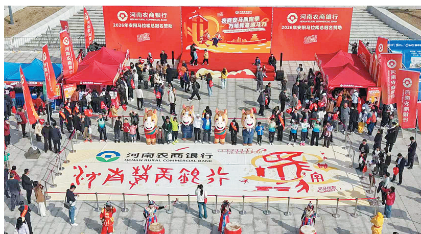
河南农商银行安阳中心支行开展主题活动

3月22日,2026“河南农商银行·甲骨文杯”安阳马拉松赛圆满收官,这场全民体育盛会,既是安阳市活力的集中绽放,更是河南农商银行安阳中心支行坚守本土初心、践行普惠使命,以“金融+体育”创新融合,赋能地方发展的生动实践。从赛前多维预热造势,到赛中全程暖心护航,再到赛后深耕产业赋能,河南农商银行安阳中心支行以地方金融主力军的担当,让金融活水融入城市发展脉络,用贴心服务传递农商温度,在春日赛道上跑出金融服务地方的“加速度”,书写深耕安阳、共赢发展的崭新篇章。