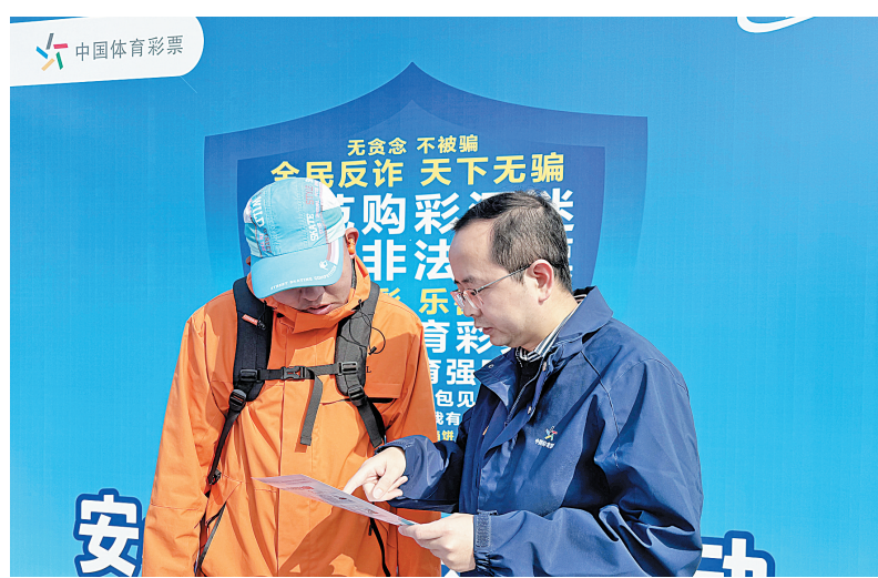
工作人员向群众宣传理性购彩、防诈骗等知识

本报(记者 牛静)3月22日,2026“河南农商银行·甲骨文杯”安阳马拉松赛鸣枪开赛,2.6万余名跑者齐聚古都,畅游文化赛道。中国体育彩票作为官方合作伙伴全程护航赛事,河南体彩安阳分中心现场开展品牌宣传与“安心购彩守护行动”。