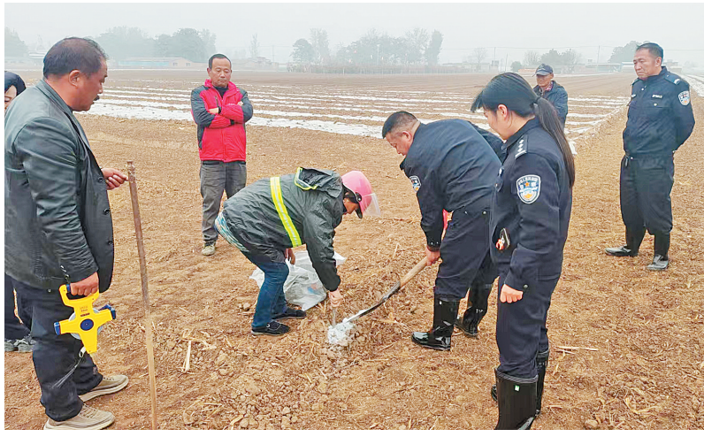
城关街道调解专班现场勘查责任田边界

一楼便民服务区域门口设置了专职引导员,专门接待来访群众,协助整理材料,指引办理流程,全程帮办代办,让群众少跑腿、不跑空、办好事。核心工作区重点整合了党建、信访、司法、综治、派出所及市场监管等多个部门的工作力量,实行“首接负责、分流处置、限时办结、闭环管理”工作机制,确保群众反映的每一个诉求都能第一时间得到响应、第一时间进入处置流程、第一时间给出反馈,实现了群