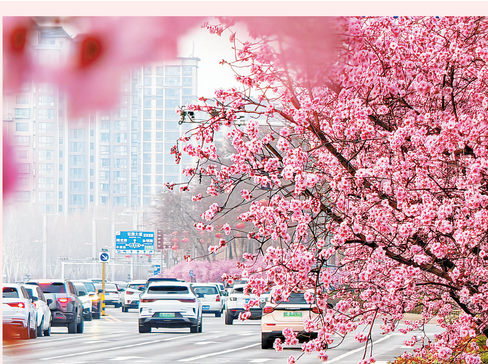
↑春风拂面,繁花盛放。连日来,随着气温逐步回升,我市中华路上的美人梅竞相绽放。粉红相间的花枝绵延成片,在暖阳下轻轻摇曳,与街巷、楼宇、行人、车辆相映成趣,绘就一幅城景交融的春日画卷。