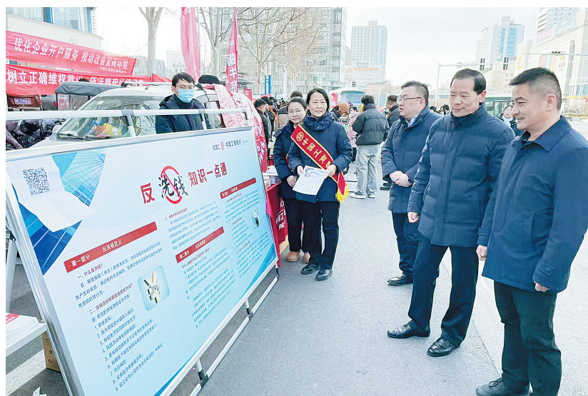
宣传现场

“我们结合近期热点话题,制作了内容生动、形式新颖的反洗钱宣传短视频,通过微信、抖音、快手等平台进行推广,以通俗易懂的语言、幽默风趣的画面,向公众普及反洗钱知识。现场还组织了有趣的活动让群众参与其中,提升