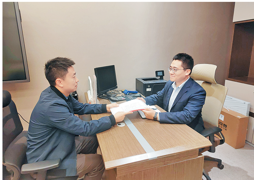
银行工作人员在为企业办理业务

2月20日,在河南艾尔旺新能源环境股份有限公司(以下简称艾尔旺),该公司负责人自豪地向中国银行安阳分行工作人员介绍。