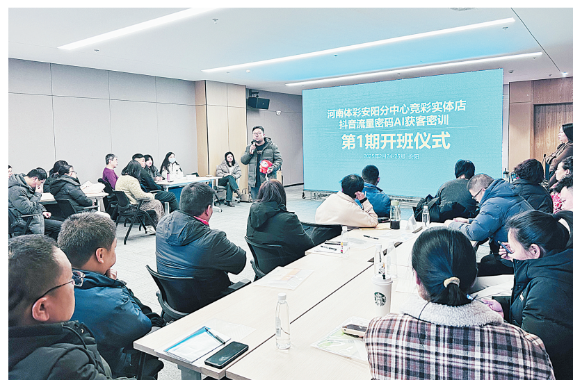
培训现场