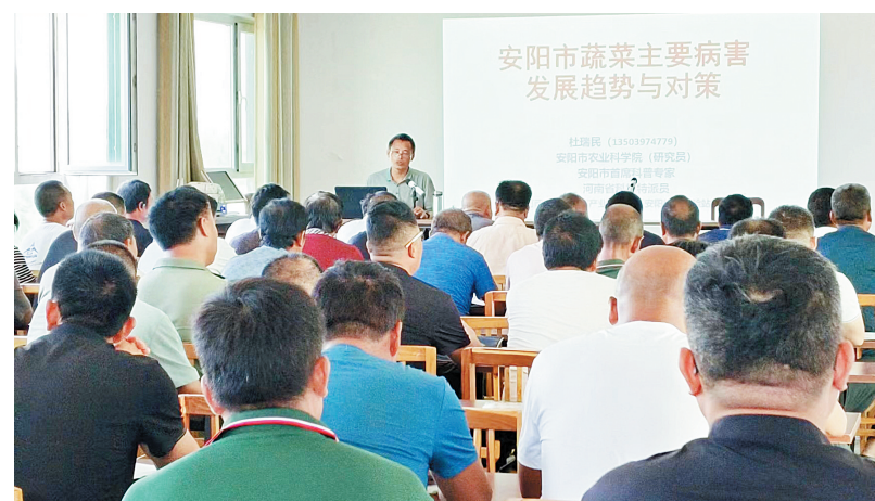
培训会现场

参加培训的人员认真聆听,详细记录,并结合实际情况向专家进行咨询,专家一一为大家答疑解惑。参训人员纷纷表示,此次培训内容充实、针对性强,学习到了很多蔬菜种植的新技术、新方法,使他们了解,感到收获满满,同时对搞好秋季蔬菜管理、为市场提供更多优质安全的蔬菜产品信心倍增。