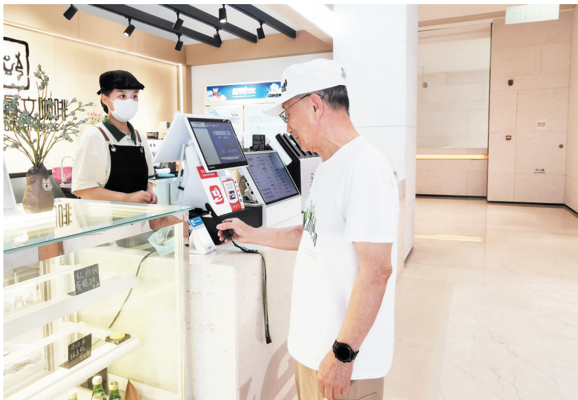
市民正在使用移动支付

我市出台《关于印发安阳市进一步优化支付服务提升支付便利性实施方案的通知》,建立跨部门协同工作机制。中国人民银行安阳市分行与市商