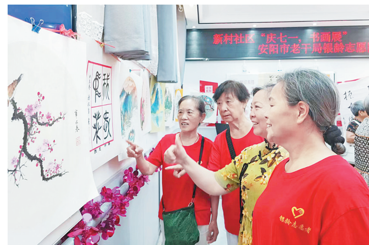
6月28日上午，市委老干部局银龄志愿服务队走进北关区豆腐营街道新村社区，和社区党总支共同举办“庆七一书画展”，展出书画作品70余幅，激发了志愿者和辖区群众爱党、爱国的热情。

此次活动丰富了社区老年人的精神文化生活，引导老年人增强健身意识，愉悦了身心，强健了体魄。“走走路，出出汗，聊聊天，心情都变好了。”参加健步走的居民说。