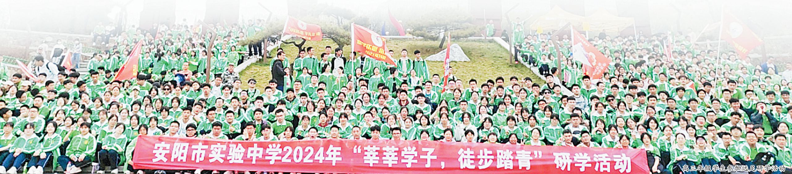
安阳市实验中学2024年“莘莘学子，徒步踏青”研学活动

逐梦新时代，扬帆再起航。展望未来，该校将坚持“办人民满意的教育”“办好群众家门口的学校”的目标，以锐意进取的斗志、严谨务实的作风和久久为功的执着，踔厉奋发、笃行不怠，奋力谱写有情怀、有温度、有责任、有特色的“群众满意的学校”新篇章。