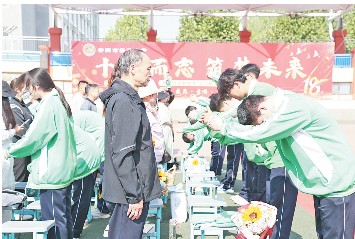
举办“十八而志、筑梦未来”成人礼仪式

空特色学校”“全国书法教育实验学校”“河南省五四红旗团委”“首批省书法教育示范校”“省科技体育传统项目学校”“安阳市书香校园”等荣誉称号。