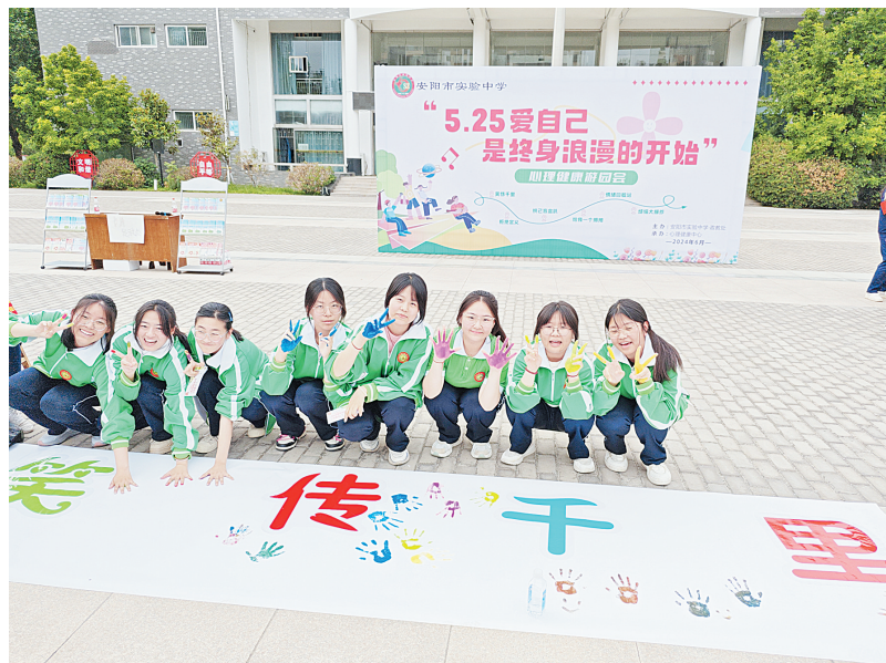
举办5·25心理健康游园活动