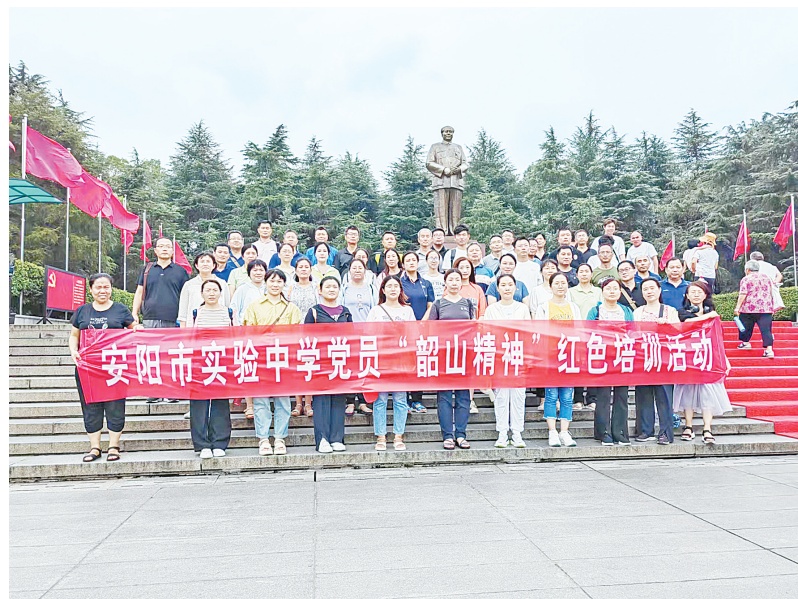
开展党员培训活动