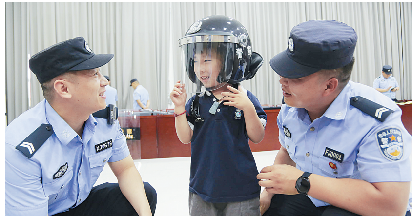
6月1日,汤阴县公安局举行“筑梦新征程,童心向未来”警营开放日活动,邀请20余名孩子“零距离”体验警营生活,与孩子们共度“六一”国际儿童节。

近年来,内黄县人民法院不断延伸审判职能,高度重视留守儿童、流动儿童保护工作,积极开展送法进校园、送法进乡村等各类普法宣传活动。下一步,该院将继续拓展司法服务,“抓前端、治未病”,推动诉源治理,从案件审理向社会治理拓展,以更丰富的形式深入开展法治宣传教育活动,播撒法治种子。