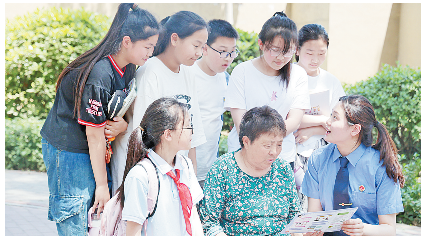
5月30日,龙安区人民检察院普法干警深入辖区学校周边开展防溺水法治宣传,现场向学生及家长讲解防溺水安全知识,增强了辖区群众的安全防范意识,有效筑牢了防溺水安全防线。