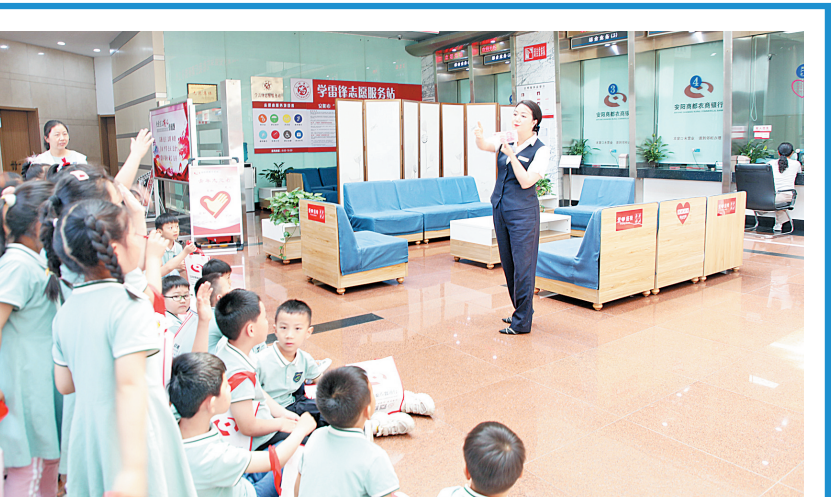
5月31日，安阳商都农商银行营业部联合周边幼儿园，开展了“小小银行家金融伴成长”儿童财商启蒙活动。孩子们在游戏中认识了人民币，了解了银行的基础功能，亲身体验了取号、排队、办理业务等环节。图为工作人员正在给孩子们讲解人民币知识。