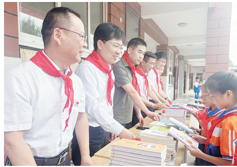
捐赠现场

此次活动不仅是物质上的接力和捐赠，更是精神上的鼓舞与鞭策。工商银行安阳分行将继续坚持开展关爱下一代公益活动，积极履行社会责任，以真情回馈社会，让公益爱心之路越走越远。