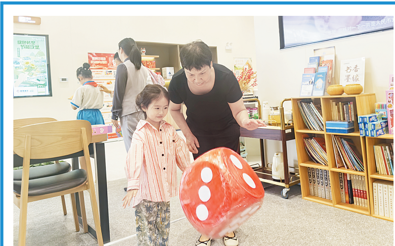
为邀约客户积极到访营业厅，提高客户活跃度，6月1日，招商银行安阳营业部邀约客户带孩子一起到网点打卡，领取节日礼品。当天，该行发放宣传折页60张，营销意向保险客户2户，参与活动65人。图为客户正在带孩子做游戏。