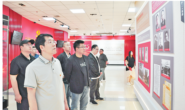
安阳市保险行业协会党员干部参观图片展(本报记者 牛静 摄)

安阳市保险行业协会党支部组织全体党员党员干部走进“庆祝安阳解放75周年图片展”,通过追忆光辉历史,激发奋进力量,用党的伟大成就激励自我,用党的优良传统启迪自我,用党的纪律规矩约束自我。下一步,该协会党支部将认真贯彻落实党纪学习教育工作要求,把加强纪律建设放在突出位置,深入学习新修订的《中国共产党纪律处分条例》,坚持原原本本学、领悟要义学、联系实际学,推动党的纪律入脑入心入行,推进党纪学习教育走深走实,并把党纪学习教育成效转化为服务行业高质量发展的动力源泉。