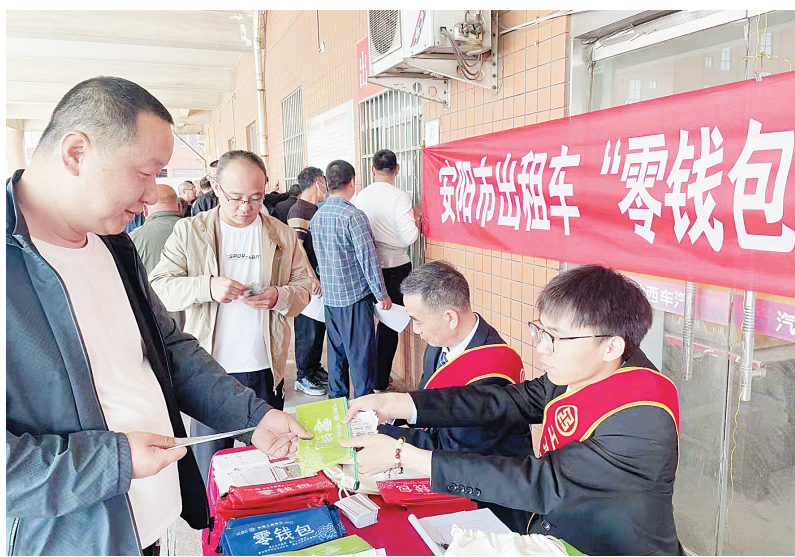
“零钱包”兑换现场

下一步,该行将常态化开展“零钱包”兑换活动,持续加大“零钱包”投放力度,确保全部网点提供“零钱包”兑换服务,着力打造渠道多样、配置灵活、获取便利、覆盖广泛的常态化服务模式。