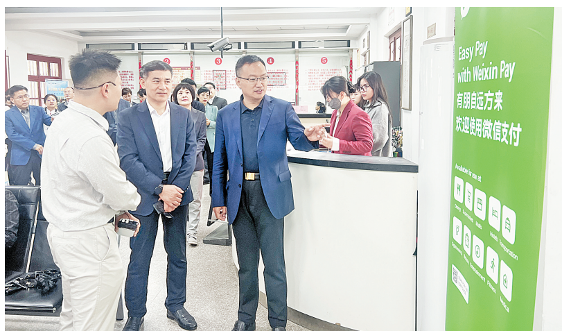
中国人民银行安阳市分行相关负责人到殷墟景区检查支付工作

坚持聚焦重点,快速推进。连日来,该分行加大对我市景区等境外来安人员集中的资源倾斜力度,由分管行领导带队,赴市文旅集团调研境外来安人员