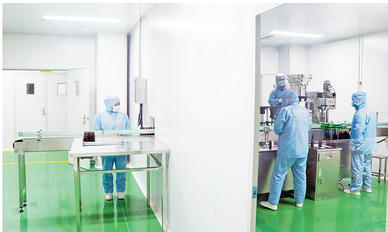
河南益特康生物药业有限公司的生产线

北采桑村种植林果约66公顷,其中桑葚约2公顷。生态观光采摘的蓬勃发展,富了果农,也给周边村民提供了就业岗位,部分村民变身“上班族”,按时上下班,按月领工资。