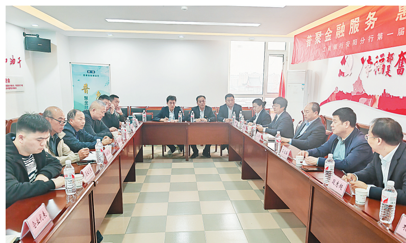
座谈会现场

本报讯(记者 牛静)为进一步支持县域经济发展,紧扣“普惠金融服务惠及千万户”宗旨,深化金融服务普惠化,持续提升金融服务质效,4月9日下午,工商银行安阳分行与汤阴县畜牧发展中心在工商银行汤阴县支行召开“养殖e贷”银企专项座谈会。