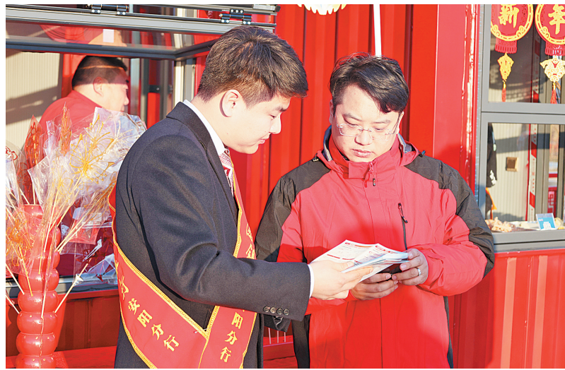
中国银行安阳分行工作人员在安阳殷墟考古文旅小镇进行金融知识宣传

这是中国银行安阳分行金融活水精准“滴灌”,助力实体经济高质量发展的一个缩影。该行坚持做好科技金融、绿色金融、普惠金融、养老金融、数字金融“五篇大文章”,锚定提升金融服务实体经济质效的方向,推动地方经济高质量发展。2023年,中国银行河南省分行与安阳市人民政府签署战略合作协议。根据协议,中国银行将对安阳市优质重点项目提供多维度金融服务支持。中国银行安阳分行深入开展项目对接,成为安阳市科技局“科技项目”首批业务合作组织。“三个一批”项目建设打开了安阳高质量发展新天地。该行牢固树立“项目为王”理念,