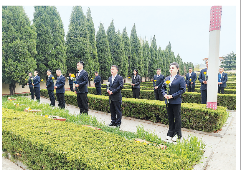
4月2日,汤阴农商银行领导班子成员和机关部分员工30余人前往汤阴县烈士陵园,开展“我们的节日·清明”祭英烈活动。

活动现场,该行干部职工在革命烈士纪念碑前向革命烈士默哀致敬、鞠躬,深切表达无限追思和崇高敬意。全体党员举起右拳,在革命烈士纪念碑前,面对党旗重温入党誓词,集体接受党性教育。