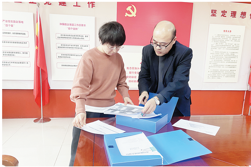
工作人员在整理材料

监管体系。根据《中国银保监会非现场监管暂行办法》《保险公司非现场监管暂行办法》等文件要求,该分局结合工作实际,归纳整理出《非现场监管工作目录指引》,以统一的非现场监管框架和制度规则,明确监管流程、职责分工和协同机制;针对被监管机构开展监管评级,依据评级结果实施分级分类监管;按照金融机构的类型和风险水