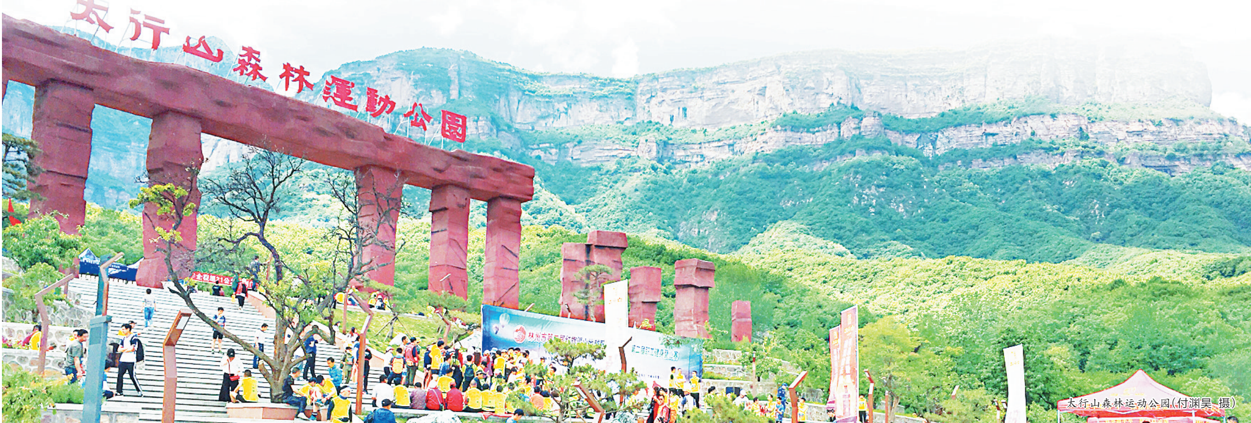
太行山森林运动公园

目标明,信心足,志更坚。在2046平方公里的林州大地上,汇聚着百万人民的无穷力量,铺就了现代化建设的崭新征程。红旗渠工匠正以敢闯敢拼、永不懈怠的精神状态勇争一流、勇毅前行,再造建筑业新优势,再铸建筑业新辉煌,再谱建筑业新篇章,誓为“中国建筑之乡”这块金字招牌增光添彩,为林州建成现代化中等城市作出新的更大贡献!