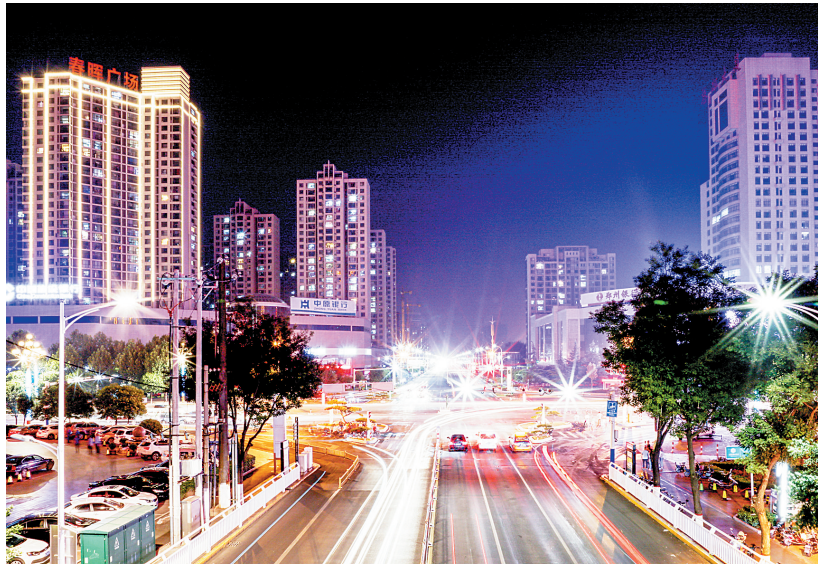
林州市夜景