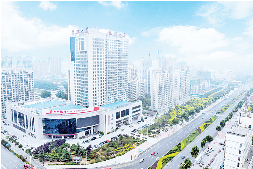
林州市美景