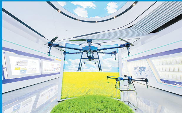
安阳全丰公司最新无人机产品