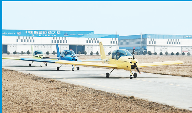
彩虹飞行表演队列队出发