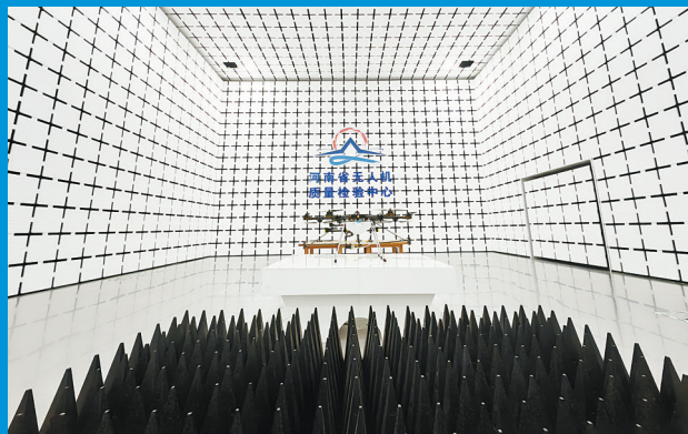
河南省无人机质量检验中心电磁兼容实验室