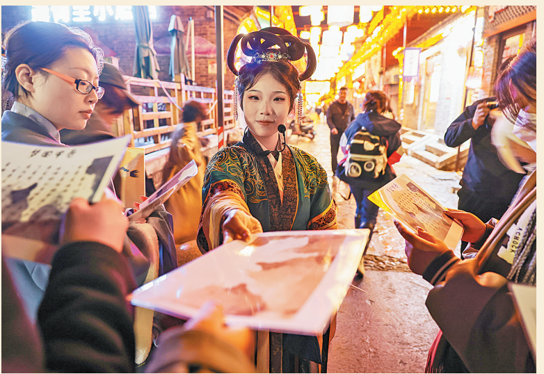
演员在古城和游客互动