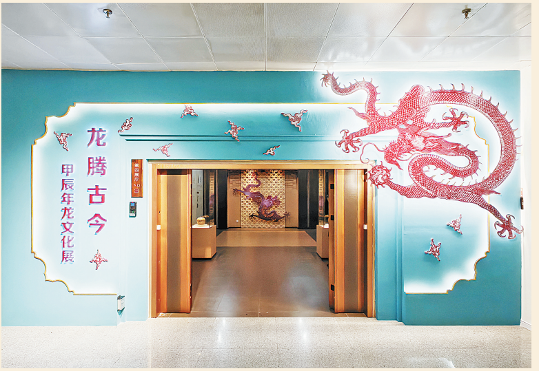
安阳博物馆“龙腾古今——甲辰年龙文化展”惊艳亮相