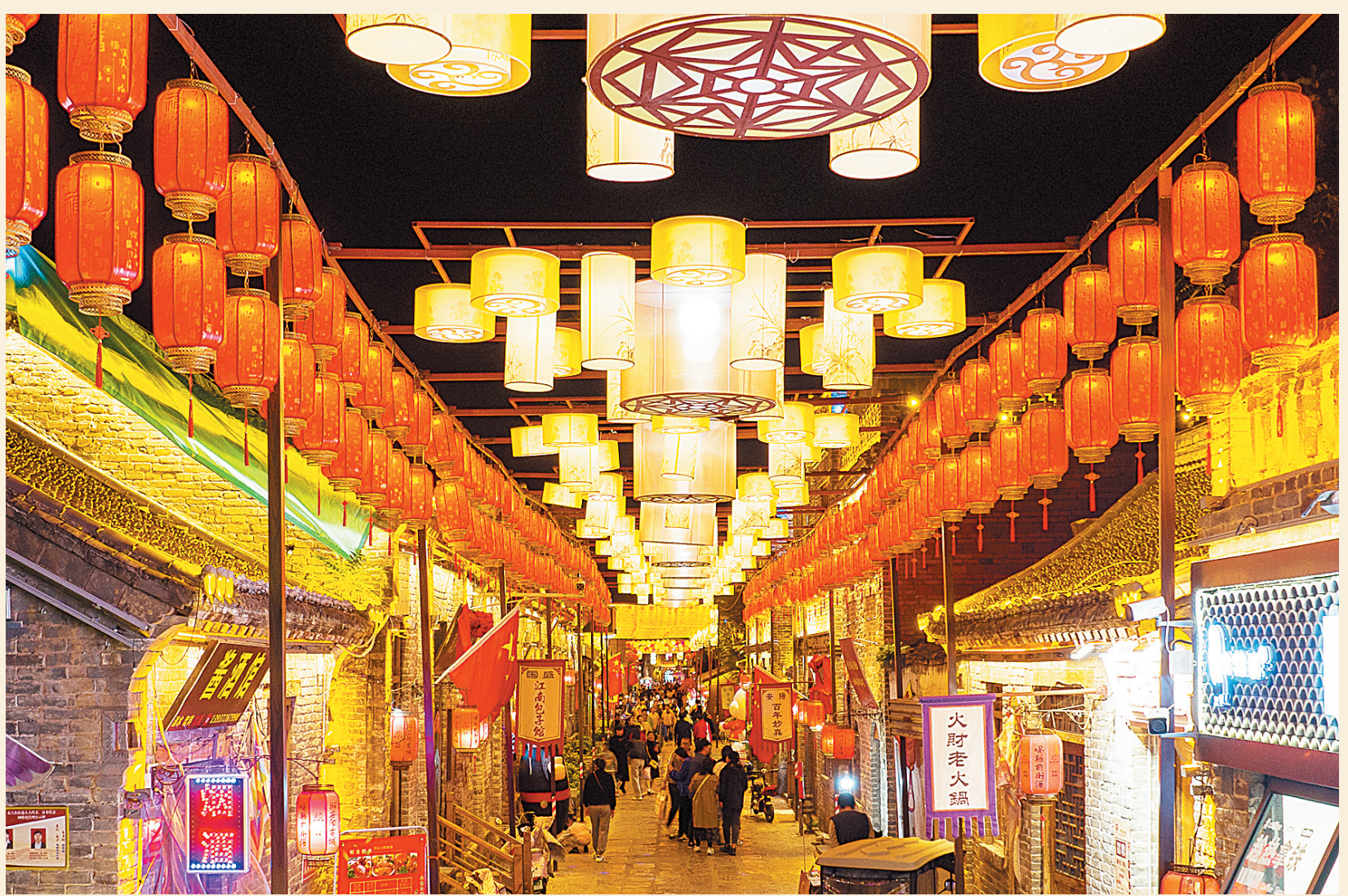
装扮一新的彰德古城

“春节期间的活动包括传统技艺、民俗表演、非物质文化遗产遗产等领域,将向游客展示独特的传统文化内涵,不仅激发人们对传统文化的兴趣和热爱,也将丰富春节期间市民群众和广大游客的文化体验。”岳岳飞庙景区相关负责人说。