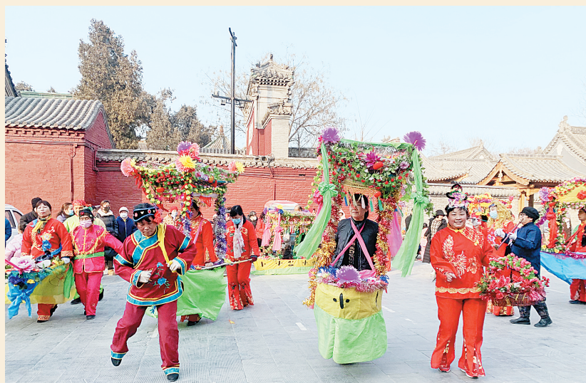
岳飞庙前的庙会活动现场