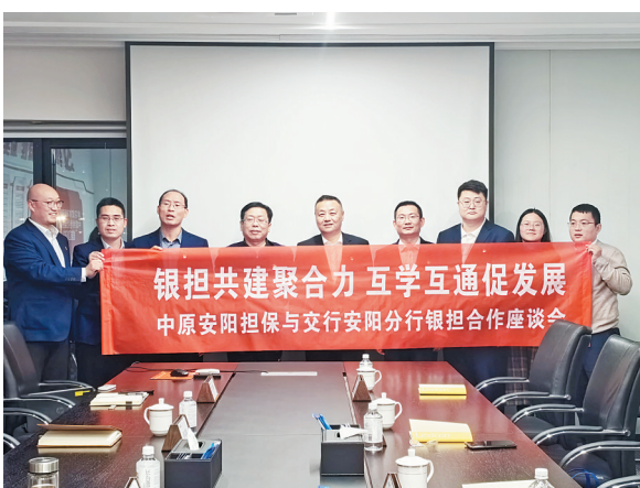
图为座谈会现场

交通银行安阳分行普惠金融事业部相关人员,中原安阳担保公司业务部、风险控制部负责人参加座谈。