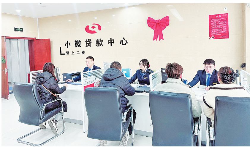
图为业务办理现场

型案例,进行针对性讲解,并通过现场互动和现场测评等方式检验学习成果,让我们受益匪浅。”内黄县农信联社工作人员表示。培训结束后,由培训老师辅导客户营销、信贷业务办理等工作,并进行同业调研。截至目前,通过培训实践,累计营销客户5000余户,添加客户微信3000余户,建立加入客户微信群450多个,调研同业机构8家。