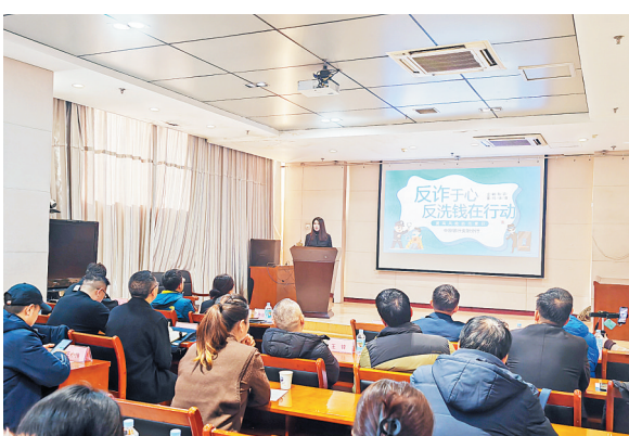
图为金融知识宣讲现场

下一步,中原银行安阳分行将持续履行好金融机构的社会责任,履行好金融宣教义务,不断创新宣传形式,助力形成“全民反诈”的良好氛围,为保障人民群众财产安全,维护社会金融秩序稳定贡献力量。