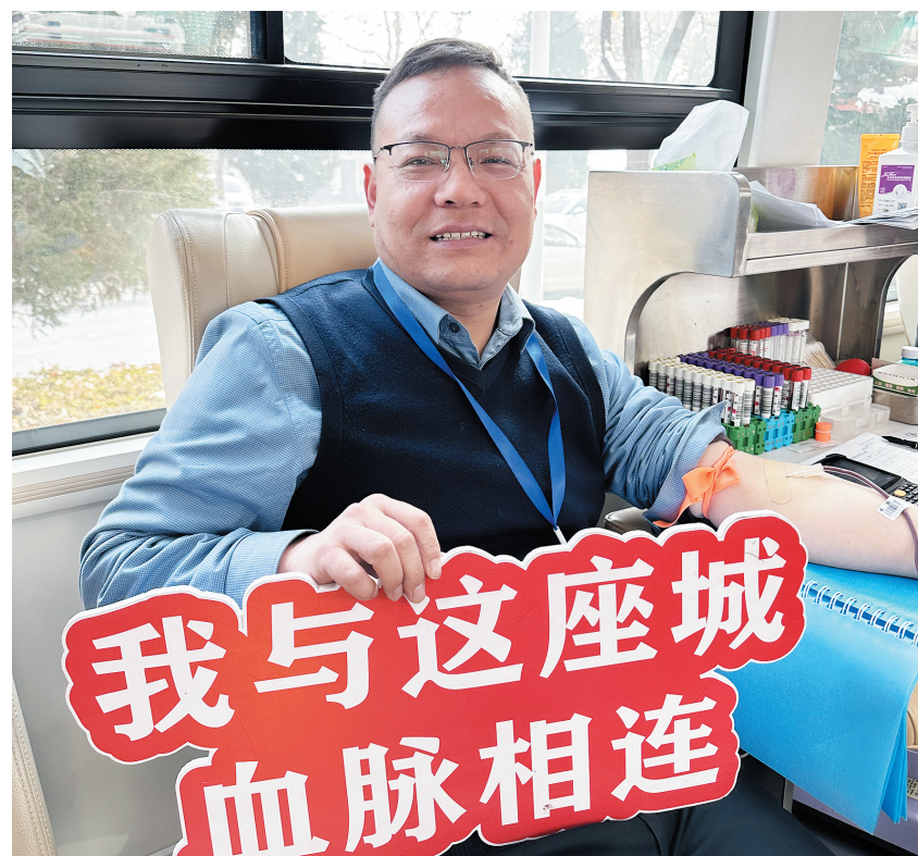
12月19日，林州市万方骨科医院组织了一次集体献血活动，医生集体参加，旨在为社会贡献一份爱心，为需要帮助的人提供一份力量。

下一步，共青团林州市委将继续整合社会各方资源，充分发挥青春助农优势，深入开展“直播+助农”活动，创新宣传载体，丰富活动内容，助推本地特色优质农产品“出圈”；拓宽农产品营销新渠道，积极探索“团支部+电商直播+农产品”联合发展新模式；团结带领广大青年投身乡村振兴和创新创业，以实际行动服务乡村振兴产业发展，让特色农产品搭乘互联网“快车”勇往直前，推动经济效益稳步提升。