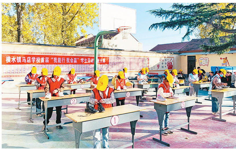
林州市横水镇马店学校首届“我能行 我会赢”学生劳动技能大赛(资料图)

近年,我市通过鼓励中小学每天开设1节体育课,切实保障学生在校内每天1小时体育活动时间。同时,我市立足体育课堂教学、大课间、课外体育活动等平台,常态化开展全员参加的体育活动,积极开展太极拳、梅花拳、太极拳、摔跤等具有安阳特色的中