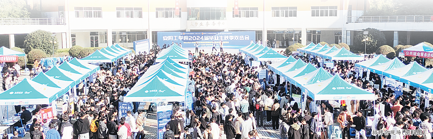
招聘会现场(资料图)

加大高校毕业生等青年就业促进力度是我市就业帮扶工作的重要部分。记者采访了解到,2023年,市人社局通过“直播带岗”“云宣讲”以及就业指导直(录)播课程等方式,帮助更多高校毕业生留安就业、在安创业,累计举办就业服务专项活