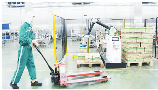
一名工作人员在车间忙碌(资料图)