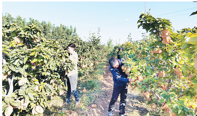
游客正在采摘晚秋黄梨

据了解,南张贾村东侧有老高采摘园、春蕾采摘园、金果园等采摘园,这几处采摘园均挂靠在汤阴县滨河生态农庄,他们依托滨河生态农庄的声望和信