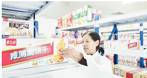
河南嘉士利食品有限公司工作人员正在查验产品