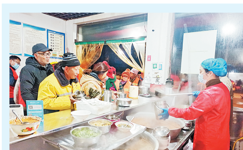
为弘扬“奉献、友爱、互助、进步”的志愿服务精神,11月11日清晨,汤阴县委宣传部、县文联组织志愿者到汤阴县爱心早餐点开展“冬日送温暖 情系环卫工人”志愿服务活动,用实际行动关爱环卫工人,为创建文明城市贡献力量。

任固镇相关负责人表示,农村“电代煤”改造是一项旨在改善空气质量、提高人民群众生活水平的民生工程。下一步,该镇将继续抓好落实,切实把党和政府的温暖送到千家万户,实实在在增强广大群众的获得感、幸福感。