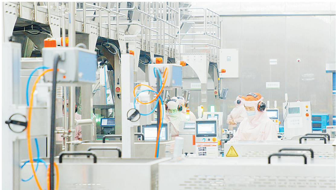
河南安井食品有限公司生产现场(资料图)