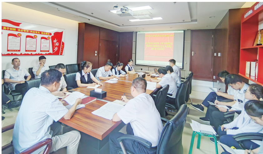
该行党员干部在上党课

今年上半年,该行召开党支部会议9次,研究议题46个,深入支行、部门开展“深调研”,开展谈心谈话21人次。该行牢固树立“把抓好党建作为最大的政绩”的观念,坚持和加强党的全面领导,在党支部书记带领下,严格履行“一岗双责”,围绕中心、服务大局,推动党建与中心工作深度融合。与此同时,该行强化常规教育,落实“三会一课”、“主题党日”、双重组织生活等制度,通过党员随身微教育、学习强国、智慧党建等平台加强常规教育实效。上半年,开展“主题党日”活动6次,召开党员大会3次,全行“学习强国”学习平台每天参学