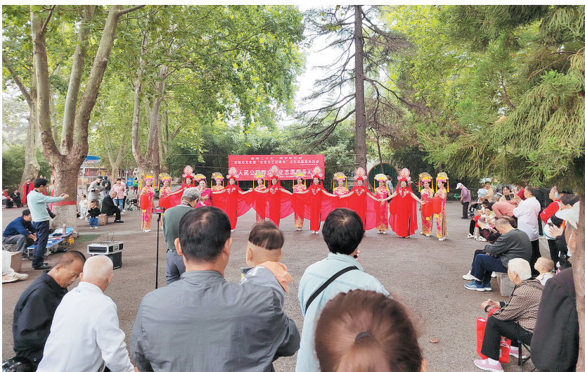
志愿服务团队为市民表演节目(资料图)

据了解,为充分利用有限的财政资金,满足群众日益增长的演出需求,市公共文化服务体系建设和协调领导小组研究制定演出团队管理政策,先后出台《进一步推进安阳市文化演