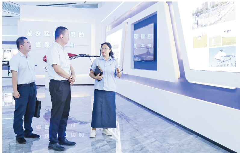
中国银行安阳县支行工作人员在安阳全丰调研(资料图)

690万元贷款帮助我们解决了季节性资金周转的困难,也让安阳全丰更有信心推进植保无人机的研发、生产和推广,探索创新航空植保农业社会化服务新模式。”如今,安阳全丰迎来了又一个朝气蓬勃、充满希望的时机,经济环境整体向好,公司发展前景明朗开阔,正积极抓订单、稳生产、拓市场,力求取得新突破。