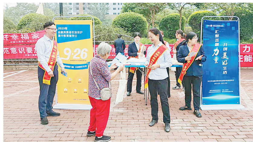
近年,中国工商银行安阳分行充分践行国有大行的责任和担当,坚持以群众需求为导向,聚焦群众“急难愁盼”问题。9月25日,该行在2023年“金融消费者权益保护教育宣传月”活动中宣传诚信文化,营造安全稳定的金融环境,树立“金融为民、金融惠民、金融便民”理念。图为该行工作人员在社区开展宣传。

展进农村、进社区、进校园、进企业、进商圈“五进入”集中教育宣传日活动。“五进入”集中教育宣传日活动采取线上、线下联动方式,全市50余家银行保险机构通过安阳市银行业协会、安阳市保险行业协会微信公众号,向社会公众发布了一系列利民惠民举措,扎实推进办实事、解民忧、惠民生、暖民心的各项工作,千方百计提升群众获得感、安全感、幸福感。