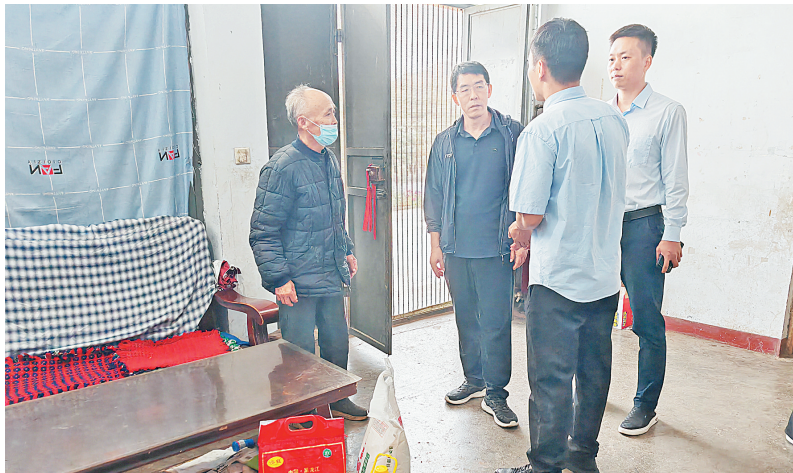
慰问现场

魏普指出,多年来,安阳保险业守责任、重担当,在全市经济发展和民生保障中发挥了积极作用。下一步,安阳保险业将凝聚行业力量,切实发挥结对帮扶作用,通过引资、引智等多种方式,共同促进上庄村发