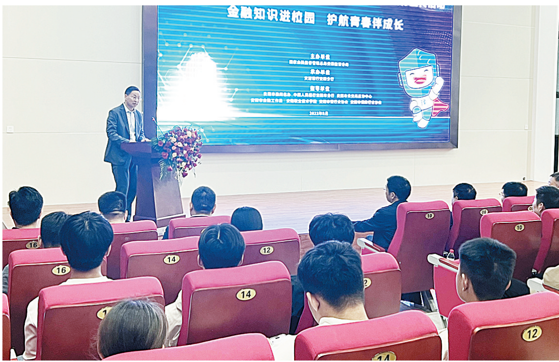
活动现场

活动现场,交通银行安阳分行工作人员通过生动的案例,深入浅出地为同学们讲解了金融消费者的八项权益、电信网络诈骗常用手段、个人信息保护、信用卡安全使用等金融基础知识,还通过有奖问答的形式,进一步提醒同学们增强金融安全意识,提升金融风险防范能