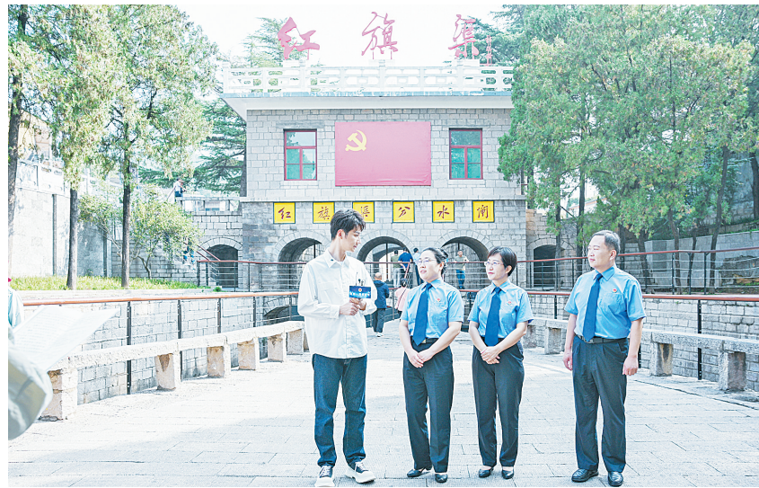
“走近一线检察官”直播现场

“走近一线检察官”直播活动第一站是“人工天河”红旗渠。位于红旗渠畔的林州市人民检察院