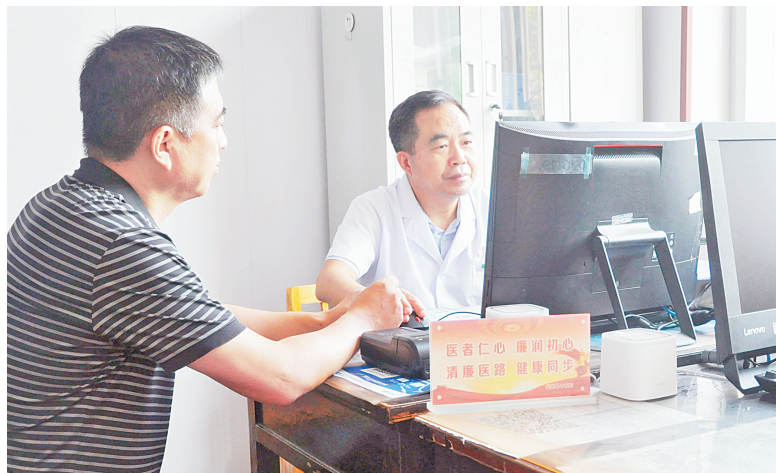
安阳县中医院医生正在给患者看病,桌上摆放着廉政宣传台签

这样的情景在安阳县(示范区)的各级医疗机构中比比皆是。今年年初以来,安阳县卫健委、安阳县医局联合下发了清廉医院建设实施方案,制定了清廉医院创建十一大行动实施细则,并选择安阳县中医院、白璧镇卫生院、北郭乡卫生院3家医疗机构作为示范试点推进,以安阳县中医院为龙头带基层一级医疗机构,以重点科室带普通科室,打造“无红包医院”。北郭乡卫生院设立“党员示范岗”“清廉科室”;白璧镇卫生院在惠民上出实招,加强医