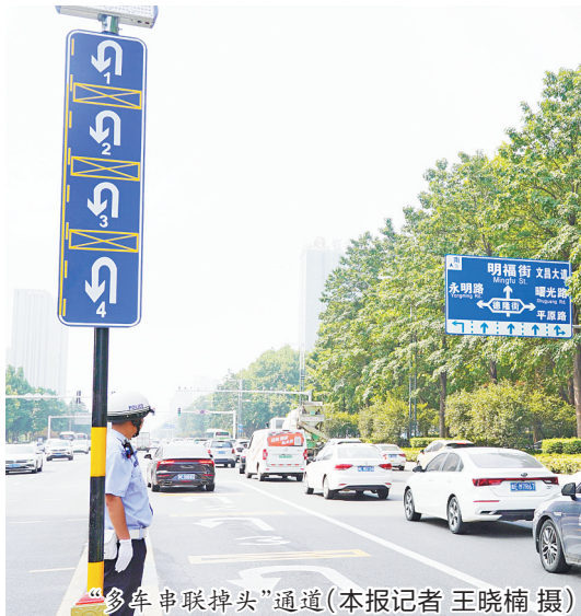
“多车串联掉头”通道

“注意观察标识标线、遵守交通规则,有序通行!也期待大家为安阳交通组织优化建言建策!”该负责人总结说。