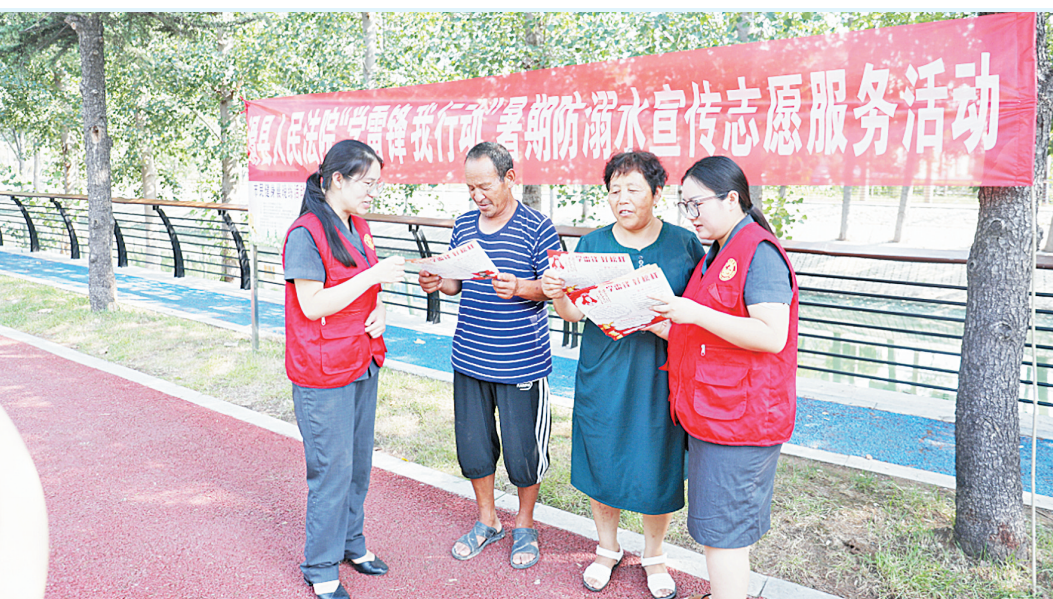
一连日来,市公安局龙安分局聚焦重点,瞄准“九小场所”开展安全检查,围绕夜间经济比较活跃、人流比较密集的场所和区域,全面排查治安隐患,加大社会治安防控和隐患排查力度。