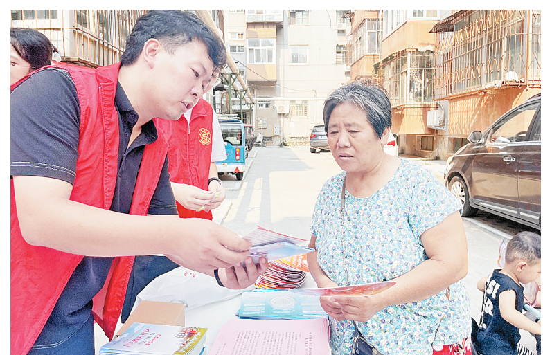
8月18日上午,文峰区司法局联合西大街街道开展安全生产警示教育日活动。工作人员向辖区居民介绍《中华人民共和国安全生产法》等安全生产法律法规,并详细讲解家庭用火、用电、用气等方面的安全常识,提醒小区住户要时刻把安全放在首位,共同营造安全、稳定、和谐的社区环境。

法院审理认为,张某以非法占有为目的虚构事实、隐瞒真相,骗取他人钱财共计80余万元,数额巨大,其行为已构成诈骗罪。综合张某犯罪事实、性质,认罪悔罪态度和主观恶性,法院最终判决张某有期徒刑8年6个月,并处罚金人民币8万元。