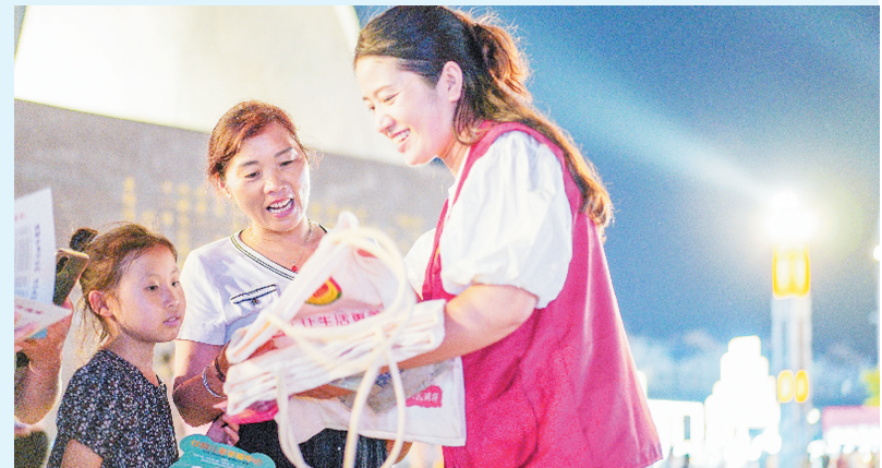
近日,滑县司法局利用“夜市经济+普法宣传”形式,走进锦和街道大云寺社区大塔夜市开展“地摊儿调解”夜市活动,共发放宣传彩页1000余份,为群众答疑50余个,营造了浓厚的法治宣传氛围。