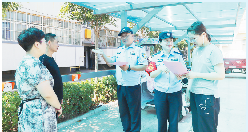
连日来,市公安局北关分局民警深入辖区开展电动自行车消防安全宣传活动。图为8月14日,民警在为群众讲解电动自行车火灾的防火常识,规范电动自行车停放、充电等行为。

8月14日,市公安局文峰分局南关派出所民警走进辖区超市开展食品安全检查工作,筑牢食品安全防线,全力保障群众的生命健康安全。