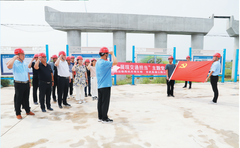
8月11日上午,市交通运输局机关党支部一行赴北郭乡,深入安罗高速公路项目一线,与京武高速公路公司党支部开展“凝聚先锋力量 展现交通担当”支部联建主题党日活动。现场,项目负责人介绍了安罗高速公路项目安阳段建设有关情况。据了解,该项目全长87.205公里,概算总投资110.83亿元,建成后将在京港澳高速公路和大广高速公路之间形成新的纵向通道,对进一步强化区域经济融合,加强中原城市群与雄安新区联系、带动沿线城市群一体发展、缓解京港澳高速的交通压力有着重要的意义。(赵慧/文)