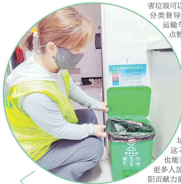
垃圾分类督导员入户宣传厨余垃圾分类知识

枫林台小区是北关区设立的垃圾分类示范小区。8月4日起,该小区开始推行厨余垃圾分类。前期,北关区生活垃圾分类办工作人员联合社区与物业在小区内进行了宣传。垃圾分类督导员带着分类垃圾桶、垃圾袋与宣传资料到居民家中,为已入住的居民发放垃圾分类物资,并详细讲解分类方法。目前,枫林台小区已入住的170余户住户中,有超过2/3的住户参与垃圾分类。每天7时至9时和19时至21时,居民可以将自家已经分类的厨余垃圾集中投放到楼下临时增设的厨余垃圾收集点。9时30分左右,厨