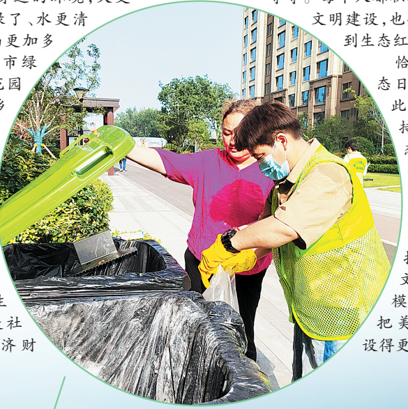
垃圾分类督导员协助市民精准投放垃圾

恰逢全国生态日,我们当以此为契机,以持续改善生态环境为己任,从当下开始,从小事干起,争做生态环境的守护者、生态文明理念的模范践行者,把美丽中国建设得更加有魅力。