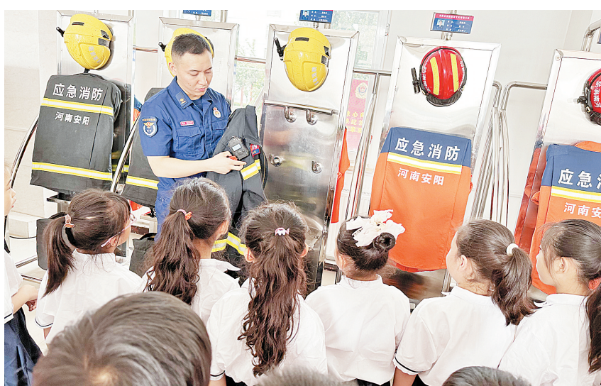
为进一步加强青少年消防安全宣传教育工作,增强消防安全防范意识,普及消防安全知识,助力“五星”支部创建,8月9日,北关区豆腐营街道庆丰社区组织辖区儿童走进消防中队,学习消防安全知识,体验消防队员日常生活。图为消防员为儿童展示和介绍消防服。

资格审查、专家评审等环节遴选出的工作基础扎实、取得初步成效的创新基地示范样板。本次评定的“科创中国”创新基地示范项目共计40个,其中产学研协作类示范项目25个,创新创业孵化类示范项目10个,国际创新合作类示范项目5个。猎鹰消防科技创新基地示范项目属产学研协作类。 据悉,“科创中国”无人机应急救援装备研发及应用示范创新基地位于安阳县(示范区)。猎鹰消防科技在去年获评首批“科创中国”创新基地后,紧密围绕无人机应急救援装备研发及应用示范工作,充分发挥市场与技术领先优势,强化外部“产学研用”资源协同联动,取得了产能建设、技术研发、装备销售等多项历史性成绩。