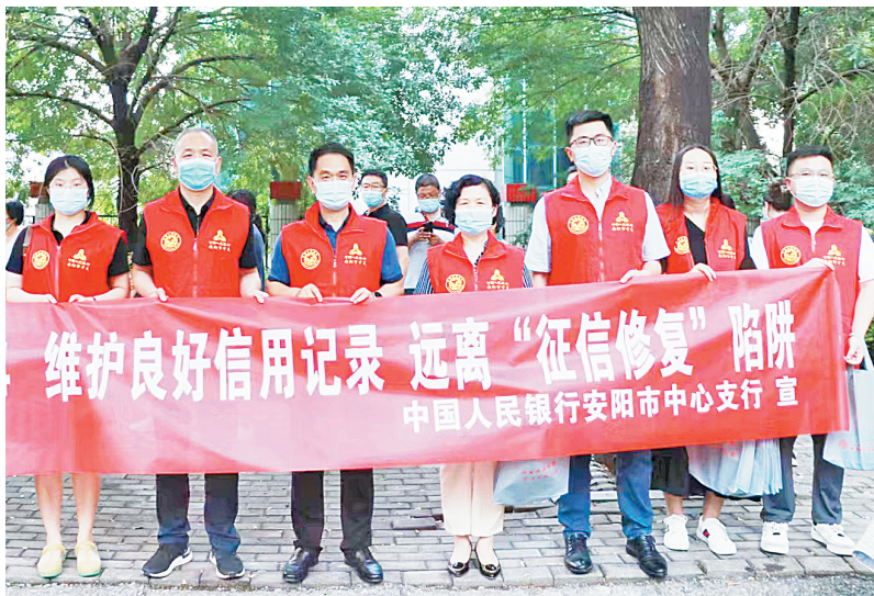
人行安阳市中支组织开展信用记录关爱日宣传活动

如何拓宽企业融资渠道?人行安阳市中支为此大力推广动产和权利担保统一登记公示系统和应收账款融资服务平台,积极配合政府推进安阳市信易贷金融服务平台建设。目前,中征应收账款融资服务平台入驻