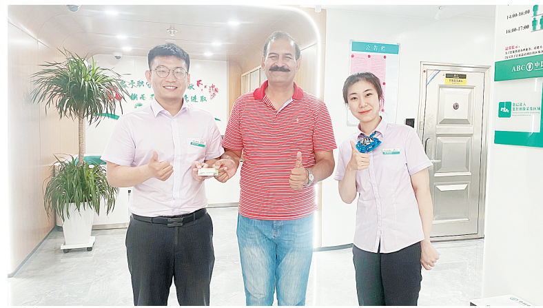
外国友人与银行工作人员合影留念

本报讯(记者 许美美)7月27日临近傍晚,农行安阳晨曦支行营业大厅里来了一位外国友人。“我的工资需要打到农行卡上,想办理一张银行卡。”该男子拿着准备好的护照、工作证明等材料,对银行工作人员说。