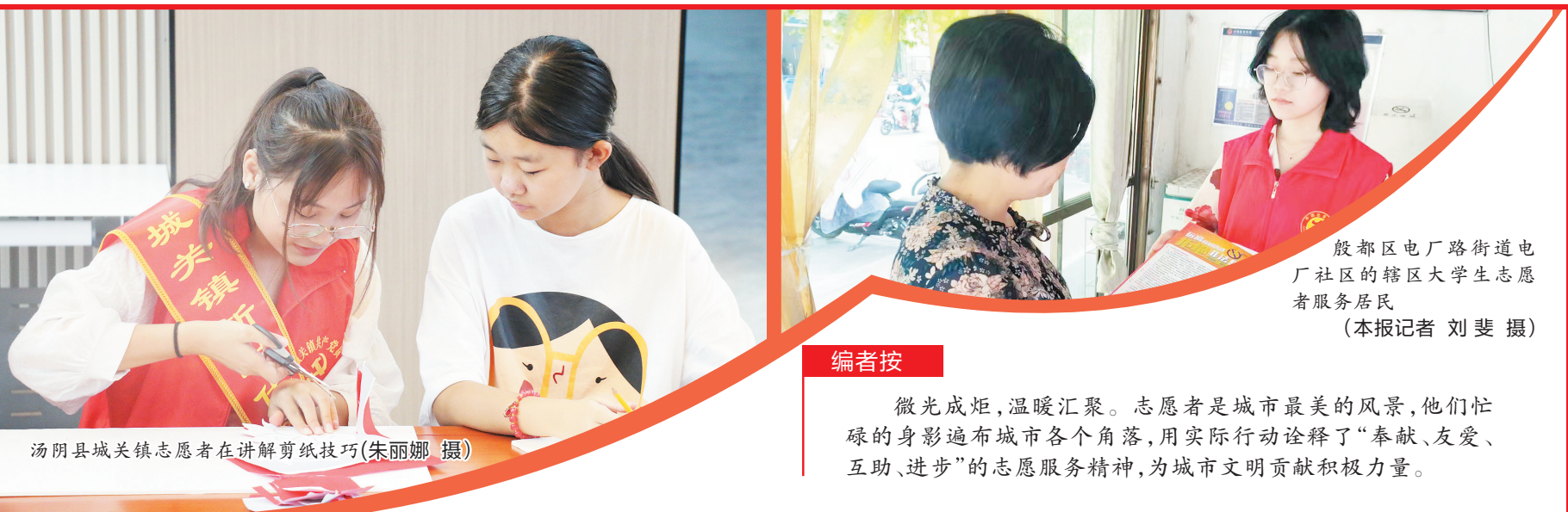
汤阴县城关镇志愿者在讲解剪纸技巧