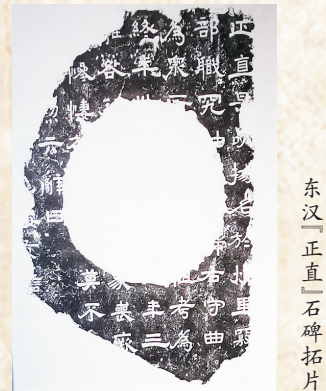
东汉“正直”石碑拓片

本次公布的全国古代1658通(方)名碑名刻文物中,汉代以前的碑刻仅156块,全省是15块,我市占两块,东汉“正直”石碑就是其中一块。该碑原名正直碑,东汉安阳残石,制刻年月不详。原石碑于安阳丰县乐镇(今安阳县安丰乡)西门豹祠内,清康熙年间(1662年~1722年),建坊时毁为柱石,嘉庆三年(1798年)徐方访得。后存安阳文化局,又转到滑县文物局。2009年滑县文物局调拨给中国文字博物馆,现存于中国文字博物馆二楼展厅,是该馆藏一级文物。