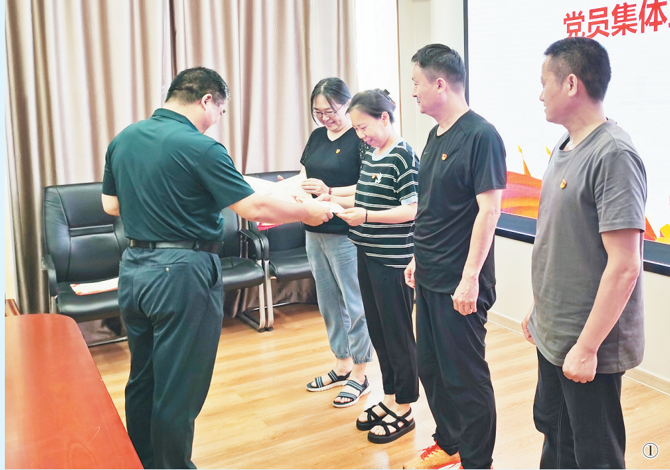
图①:市医保中心党支部为支部全体党员建立“政治生日”台账,让党员感受到党组织的关怀和温暖,进一步增强了党员的归属感、荣誉感和使命感。图为7月14日,市医保中心党支部开展“共过政治生日、永葆党员本色”活动现场。