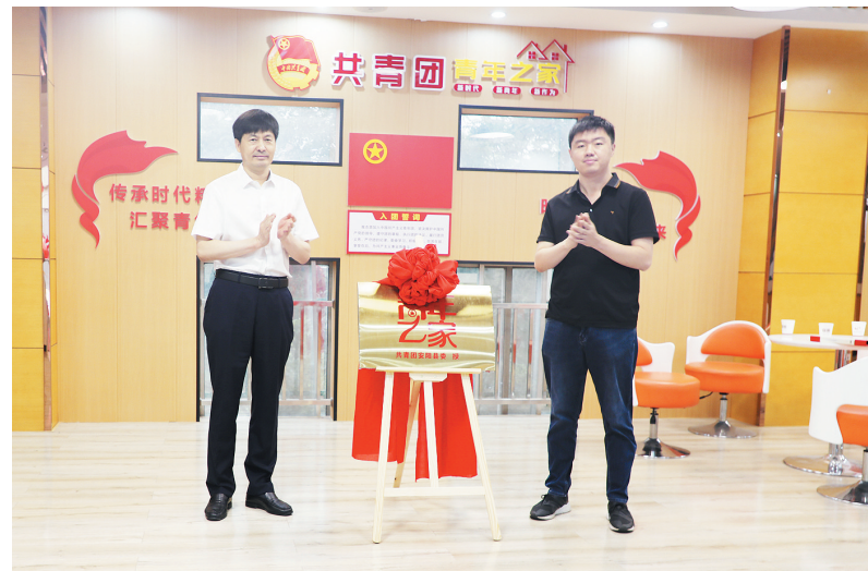
揭牌仪式现场

本报讯(记者 牛静)为深入学习贯彻党的二十大精神,加强团组织阵地建设,进一步鼓舞广大青年更好地投身乡村振兴大局,安阳商都农商银行于近日举行了“青年之家”揭牌仪式。