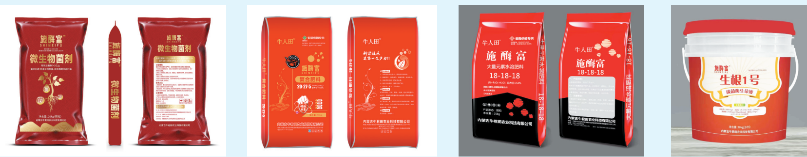
(本组图片均为资料图)