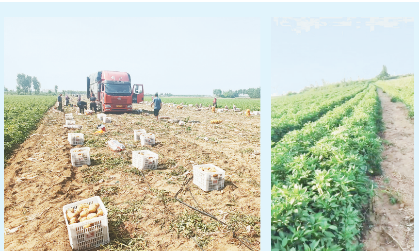
试验田种植的土豆喜获丰收 试验田种植的辣椒长势喜人